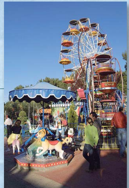
Noria infantil, tikal, hawaii y los rápidos.

Estos gastos serán asumidos por la Asociación , y desde aquí agradecemos la gentileza de la dirección de este parque, que nos aplica unos precios especiales.