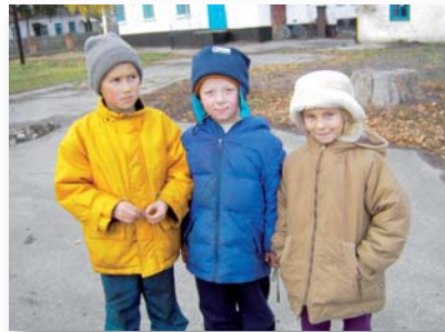
Niños del Internado de Tarashcha.

Como en anteriores años, durante estos últimos meses se han realizado por parte de miembros de la Junta Directiva varias sesiones informativas sobre nuestra Asociación en diversas localidades de Aragón: Zaragoza, Tarazona, Borja, Cariñena, Zuera, Muel, Épila, Alcañiz, Alcorisa, Calaceite, Teruel, Graus, Huesca, Almudévar y Barbastro.