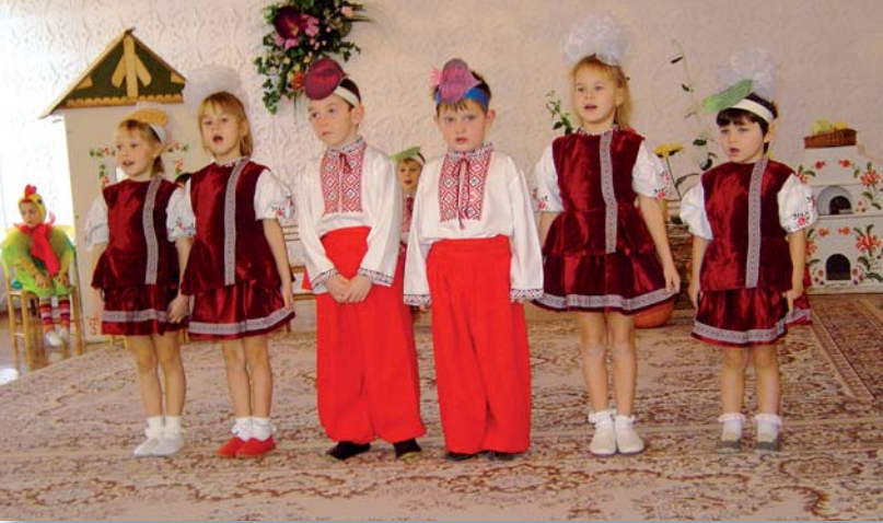
Niños del internado de Boloshka.