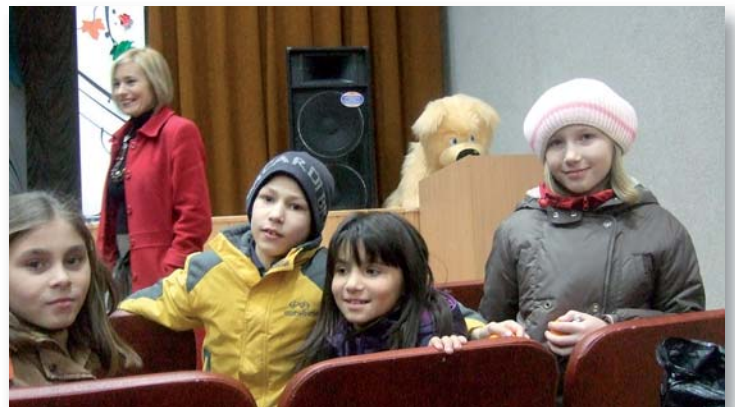
Internado de Volodarka.

Ánimo, gracias a todos vosotros y colaborad en traer a nuevas familias que puedan darse el premio y la satisfacción personal de ayudar a una criatura a crecer como personas, tanto en lo físico como en su desarrollo interior de seres humanos.